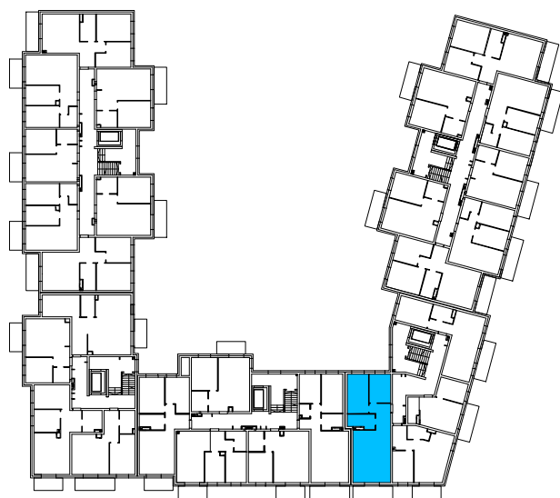
Rzut PARTERU budynku z zaznaczeniem położenia lokalu mieszkalnego